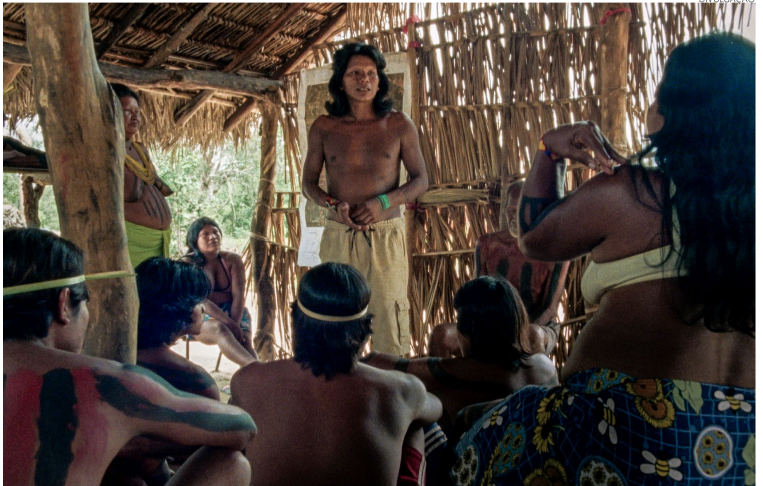
Costumes: longa-metragem retrata capacidade de viver na natureza, com natureza

Tudo isso faz parte, no filme, de uma cuidadosa construção, que envolve lendas, animais, mitos. A invasão começa pelo roubo das araras, pela tensão com os capangas na porteira da reserva, com discretos triunfos. Mas também com a humilhação de, ao frequentar a escola dos brancos, serem advertidos porque seus trajes não são bons o bastante, seus cabelos compridos têm de ser cortados.