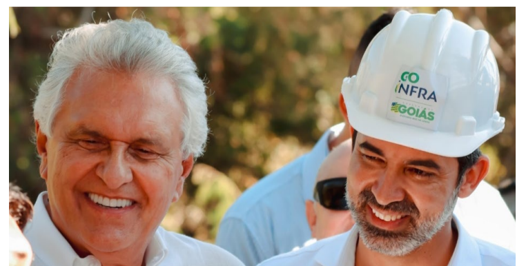
Moradias fazem parte do programa Pra Ter Onde Morar: parceria de governo e prefeitura