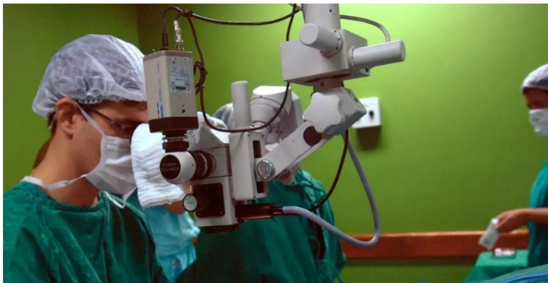
Instituto do Câncer (Inca) diz que este é o sétimo tumor mais incidente entre os homens

Julho é o mês de conscientização da doença. Assim como em outros tipos de câncer, tabagismo é o principal fator de risco da neoplasia