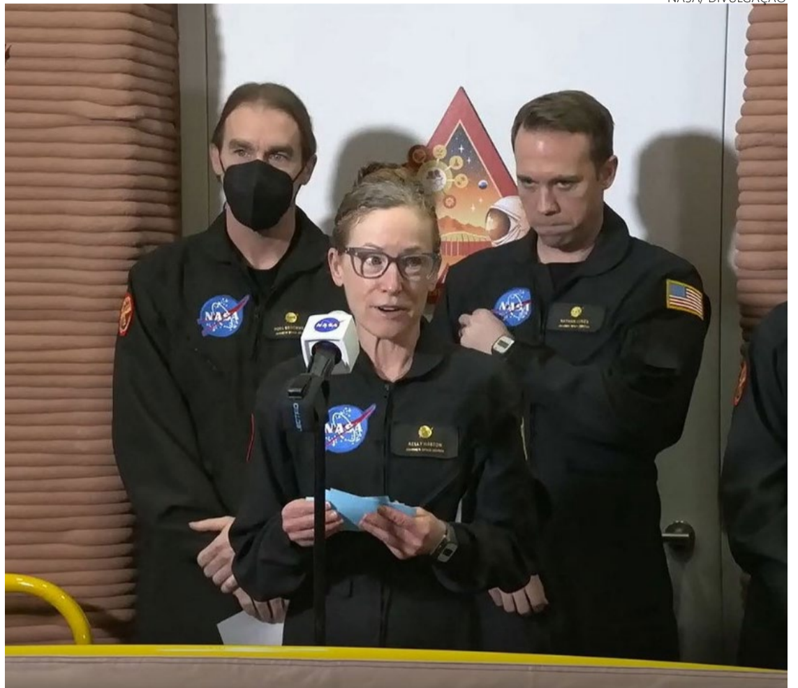
Simulação imersiva forneceu dados sobre saúde, desempenho e dinâmica da tripulação

Esta missão de simulação permitiu à Nasa coletar informações cruciais para o planejamento de missões tripuladas para Marte. Os resultados ajudarão a melhorar as condições de vida e trabalho dos futuros astronautas, a gerenciar os recursos de maneira mais eficiente e a preparar as tripulações para os desafios psicossociais das missões de longa duração.