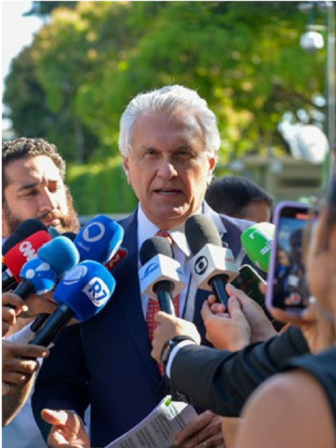
Ronaldo Caiado: falta ao governo federal políticas públicas de segurança eficazes

Além disso, a redação inicial inclui na Constituição o Sistema Único de Segurança Pública (SUSP) nos mesmos moldes do SUS (Sistema Único de Saúde). Na terça-feira, o próprio presidente Luiz Inácio Lula da