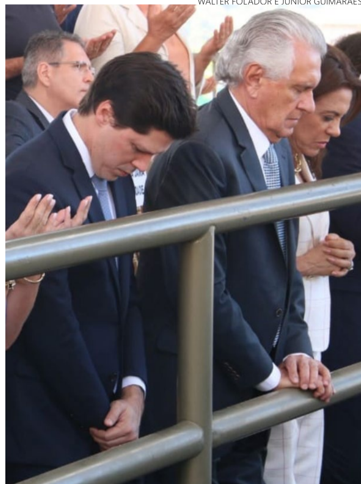
Governador Ronaldo Caiado destaca grandiosidade da festa de Trindade: celebração teve dez dias de eventos e missas