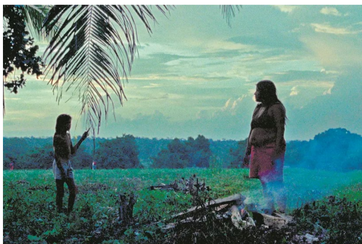
Questões indígenas: filme amplia debate

Tudo isso faz parte das duzetas cotidianas, que convivem com banhos magníficos no riacho, com incursões pelas matas etc.