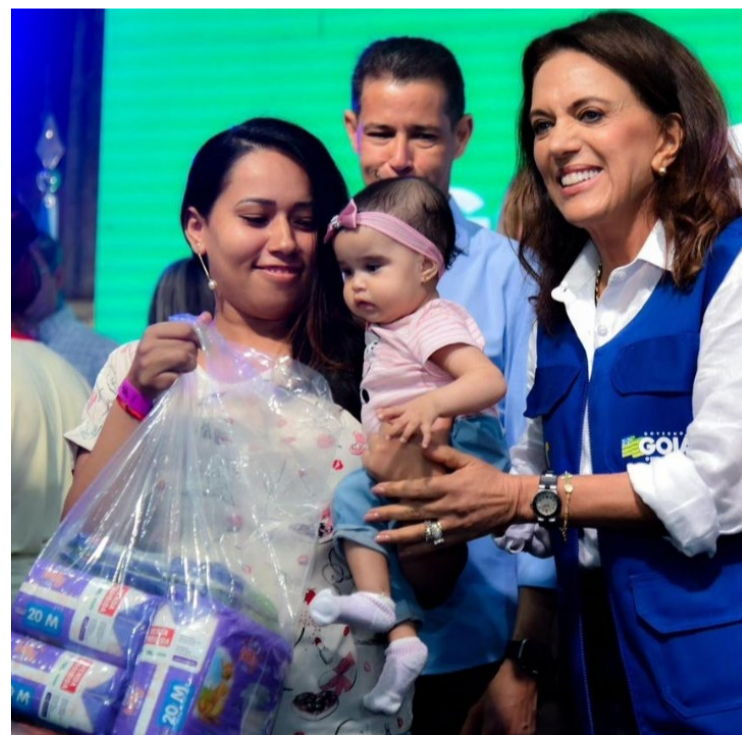
Goiás Social e OVG: marca histórica de 5,7 milhões transformou a assistência social no Estado

Em 2021, o Governo criou e lançou o Mix do Bem, um produto completo e nutritivo, feito com arroz, proteína de