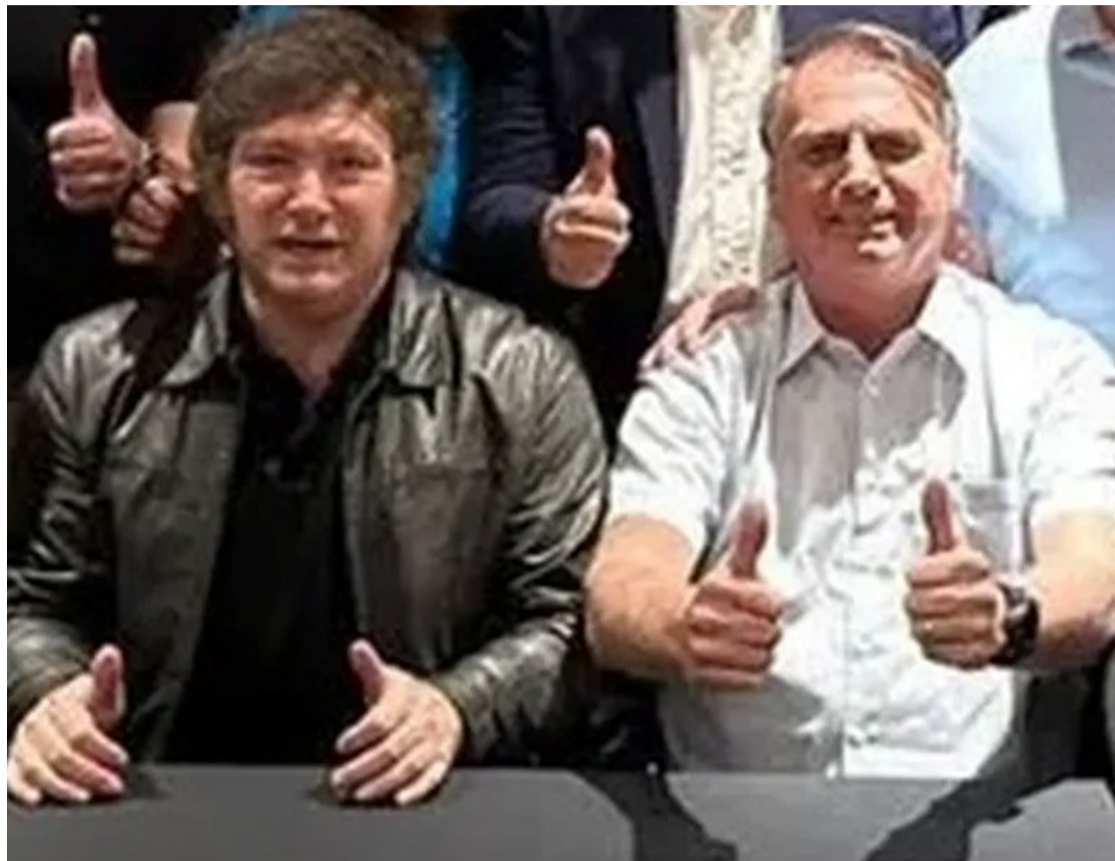
Javier Milei e Jair Bolsonaro: afinidade político-ideológica de direita na América Latina

Segundo informações do jornal ND, de Santa Catarina, Milei chegou em solo catari-