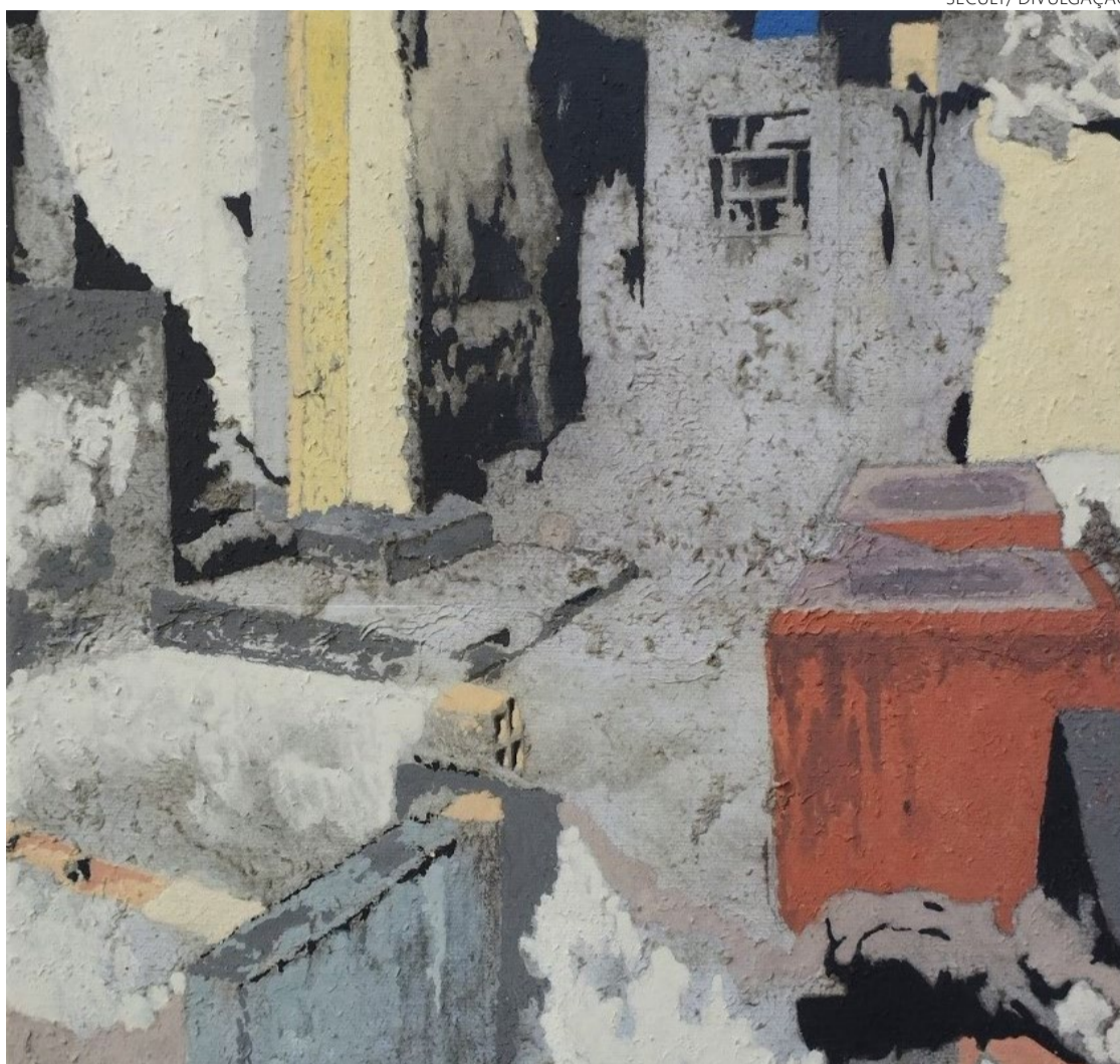
Afetividade: interferências artísticas perpassam pela justaposição ou não de imagens

As interferências artísticas, carregadas de afetividade, perpassam pela justaposição ou não de imagens, escarificação da matéria e, sobretudo, pelo uso da pintura em telas e ma-